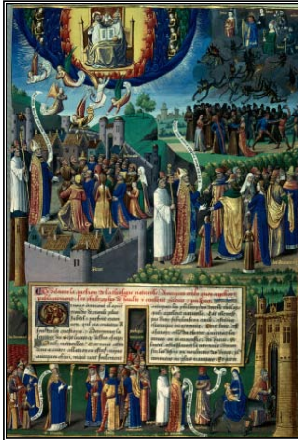
Saint Augustin d'Hippone, De Civitate Dei contra paganos , Paris, vers 1480.